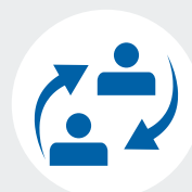
Stage e placement