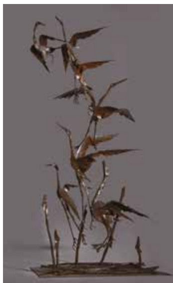
Aldo Caratti Volo dei trampolieri 1955

A latere del convegno "Carnem manducare", la scelta dei pezzi risulta particolarmente significativa, perché i soggetti ritratti richiamano il tema della carne ispirato al racconto biblico dell'arca di Noè, come la