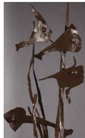
Aldo Caratti Pesci scalari fine anni Sessanta, particolare