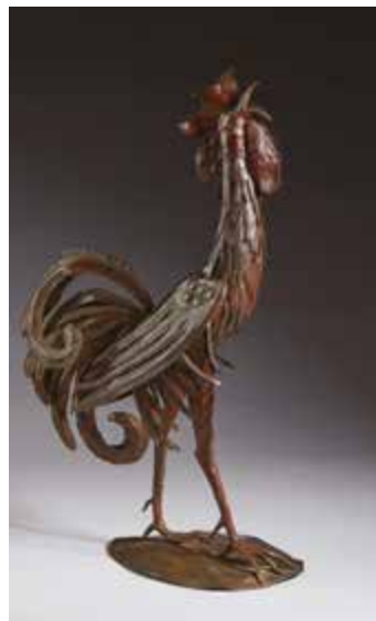
Silvano Bellini Gallo canterino 1970 circa