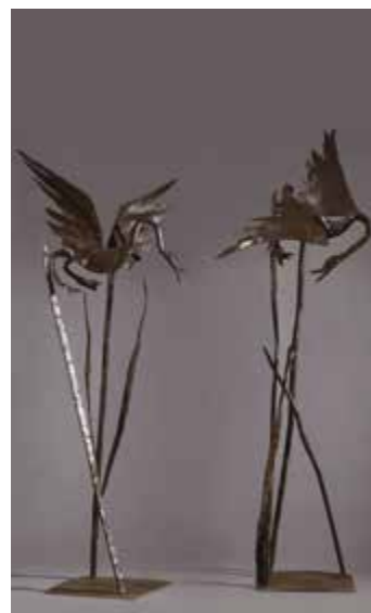
Aldo Caratti La battaglia dei cigni anni Sessanta