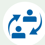
Stage e placement