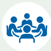
Orientamento e tutorato