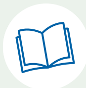
Libreria e biblioteche