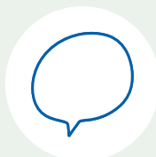
Servizio linguistico d'Ateneo