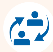
Stage e placement